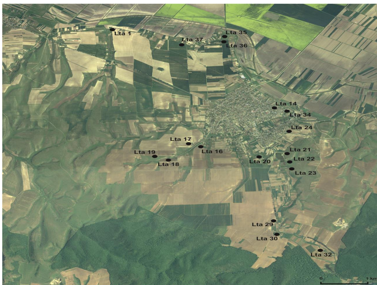
Fig. 1. Luncavița. Descoperiri atribuite epocii romane / Luncavița. Roman period discoveries.

Situl Lta 23 – la aproximativ 100 m sud de situl Lta 22, pe panta unei coline, pe partea dreaptă a văii Luncavița. În anul 2012, cu ocazia unei cercetări de teren organizate de ICEM Tulcea, au fost semnalate fragmente ceramice atribuite epocii romane 30 . Având în vedere poziția sa și încadrarea materialului arheologic, nu excludem posibilitatea ca și acest sit să corespundă cu cel din punctul La pășunat , identificat de E. Comșa, în 1951;